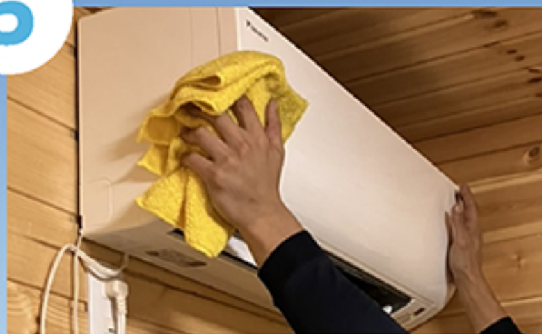
外装パーツ取付け