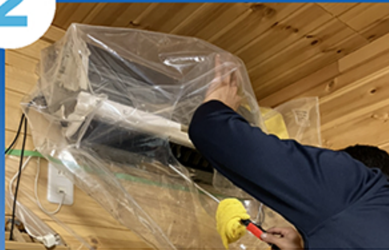
洗剤散布・高圧洗浄