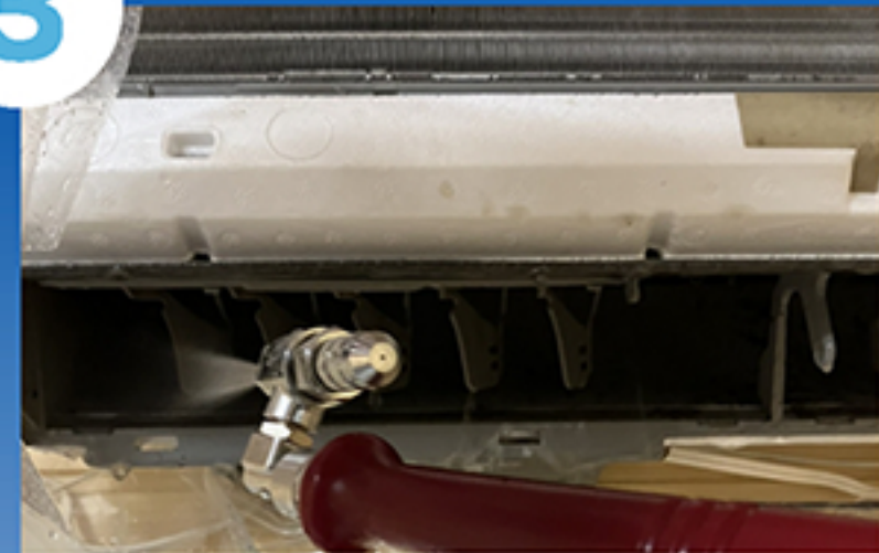
中和剤散布・高圧洗浄